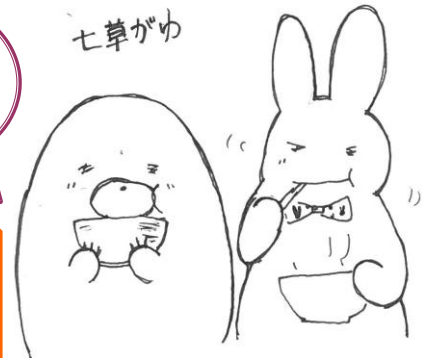
意地でも食べる イラストあいすくりん