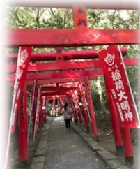
ドライブしたり、スポーツしたり、物作りを楽しんだり、色んな事にチャレンジしました。