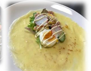
調理実習で、美味しいお料理をたくさん作りました！