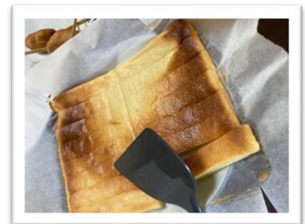
スティックチーズケーキ