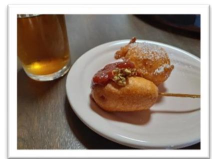
アメリカンドッグ&豆腐入りドーナツ

★ホットドックが一番おいしかったです。5本食べました。まあ、全部おいしかったです。★味が気になっていたチーズケーキ美味しくて、うれしかったです。アメリカンドッグもすごくおいしかった。