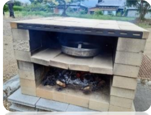
手作りピザ窯で贅沢な美味しさを体験