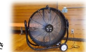
お借りした巨大扇風機(笑)